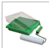
Osmo Mikrofiber roller