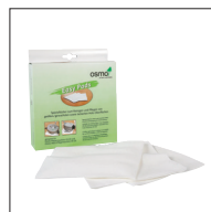
Osmo Easy Pad